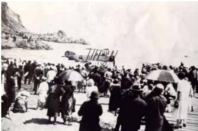
Playa Las Torpederas, Playa Ancha, 1920.