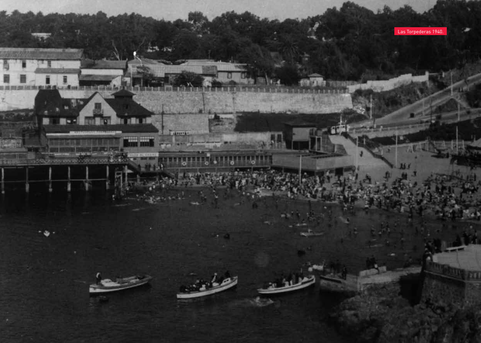
Las Torpederas 1940.