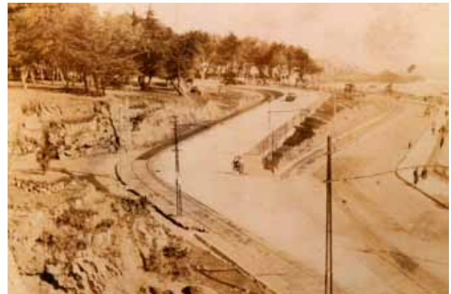
Av. Altamirano, Subida Carvallo, 1930.