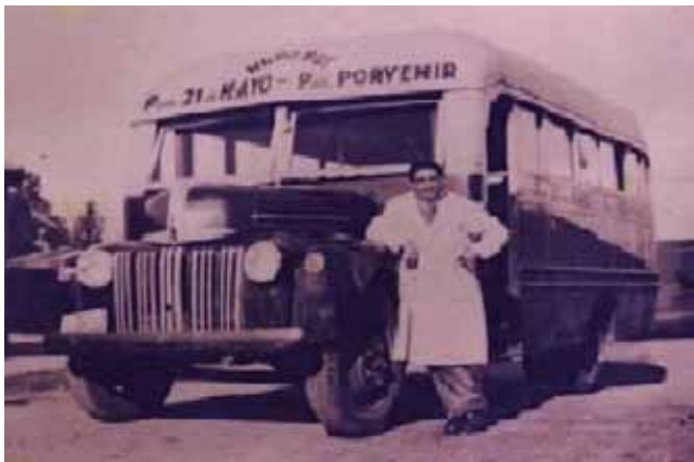
Transporte a Porvenir.