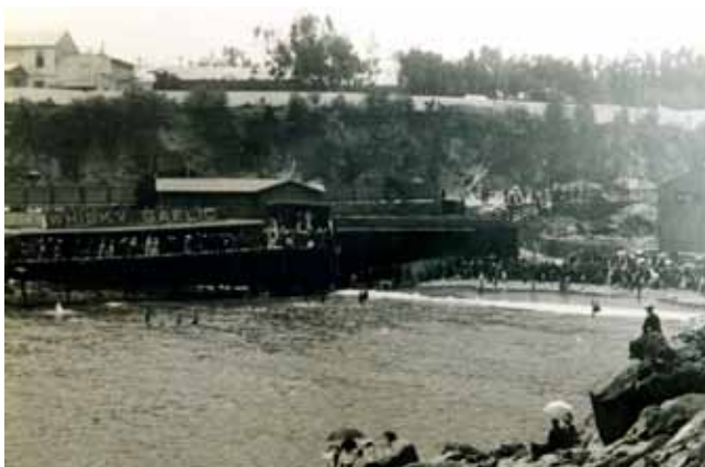
Las Torpederas 1920.