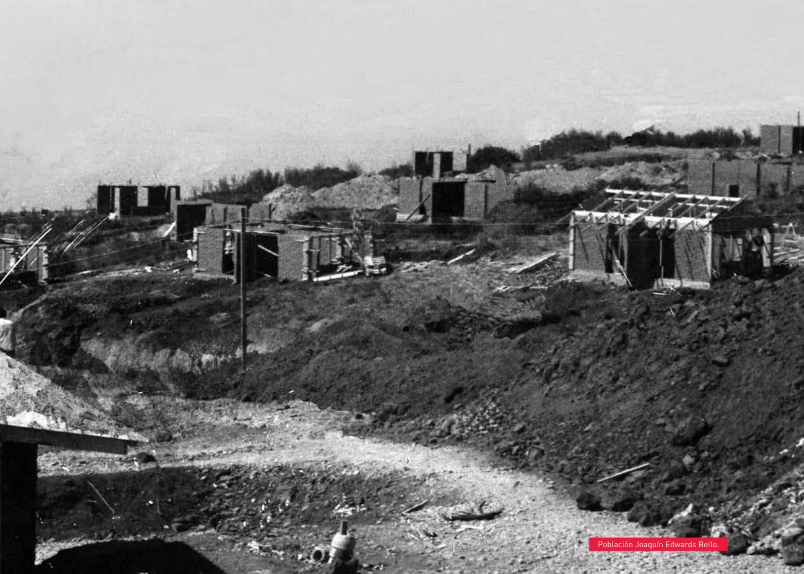
Población Joaquín Edwards Bello.