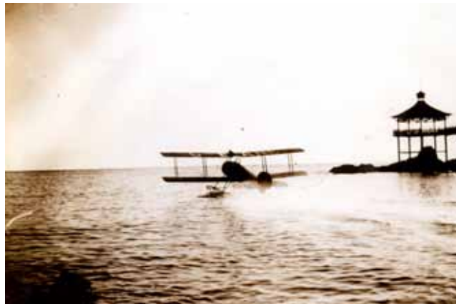
Las Torpederas 1920.