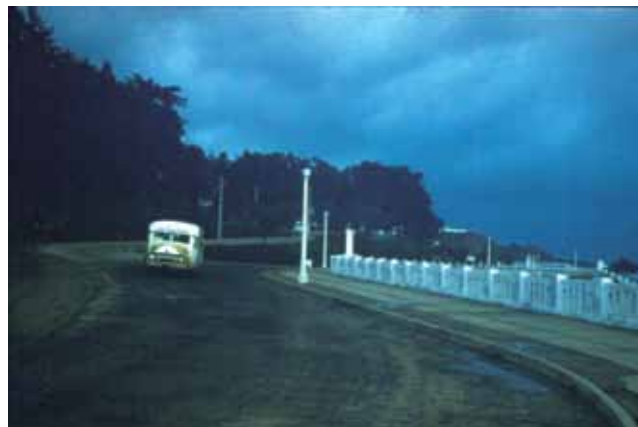
Av. Altamirano, 1958.