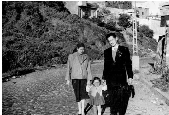
Calle Taquedero mitad S. XX.