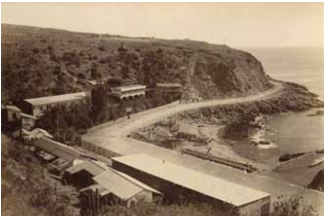
Antigua fotografía de la famosa caleta El Membrillo de Valparaíso.