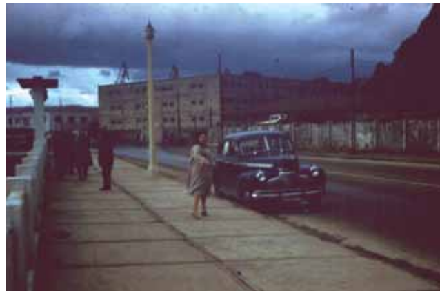
Av. Altamirano, 1958.