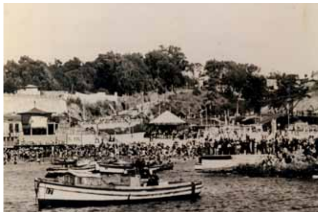
Las Torpederas 1940.