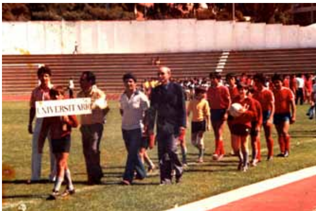
Club Deportivo Universitario, años 70.