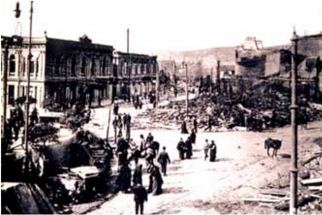
Av. Pedro Montt 1906 (terremoto).