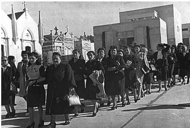
Inauguración bóveda No 2 de la Sociedad "Unión y Protección de Obreras", Cementerio No 3 (1949).