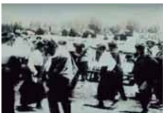
Paseo a Playa Ancha, 1903. Actualmente es la película chilena más antigua que se puede ver. Filmada por el francés A. Massonier, quien llegó como parte de los enviados por Lumiere a recorrer el mundo. Perteneciente al archivo de la Cineteca del Centro Cultural Palacio La Moneda.