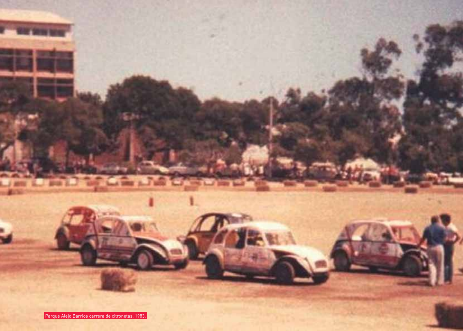
Parque Alejo Barrios carrera de citronetas, 1983.