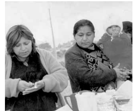
Población Joaquín Edwards Bello.