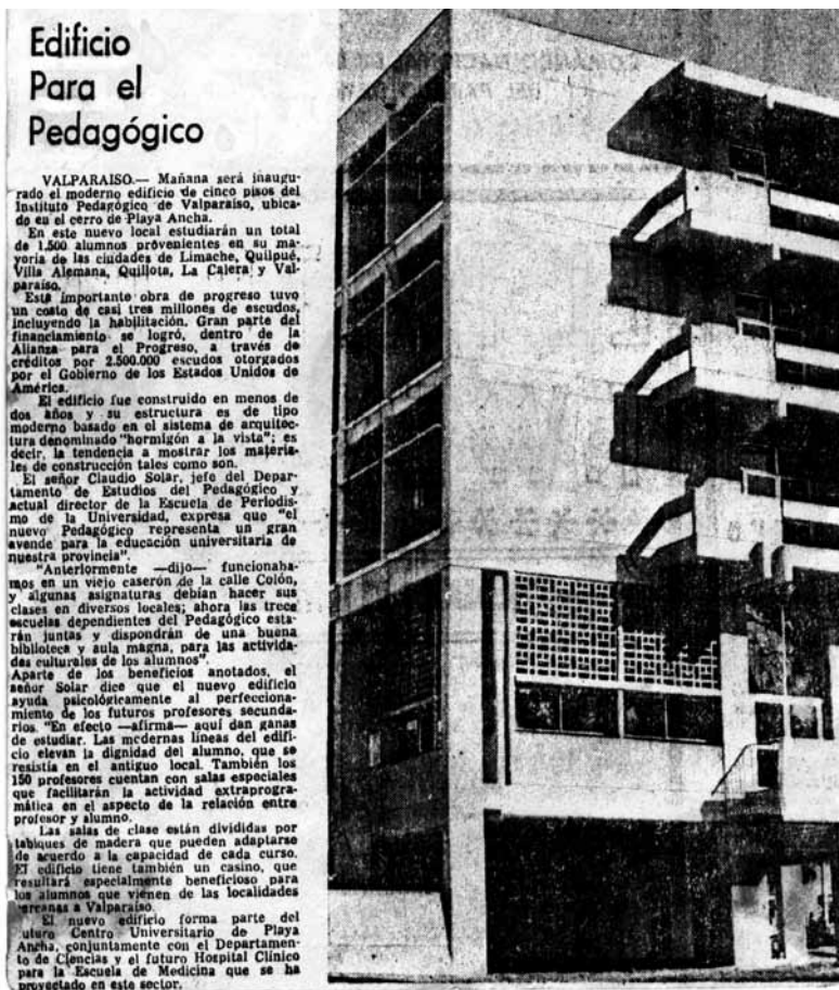
Nota periodística sobre la inauguración de la sede central del ex Pedagógico (actual UPLA), 31 de marzo de 1967.

Ya en los años '60 Playa Ancha era sede de las concurridas fiestas realizadas en la playa Las Torpederas y en el Paseo 21 de mayo, cuando se celebraba la "Fiesta de la Primavera".