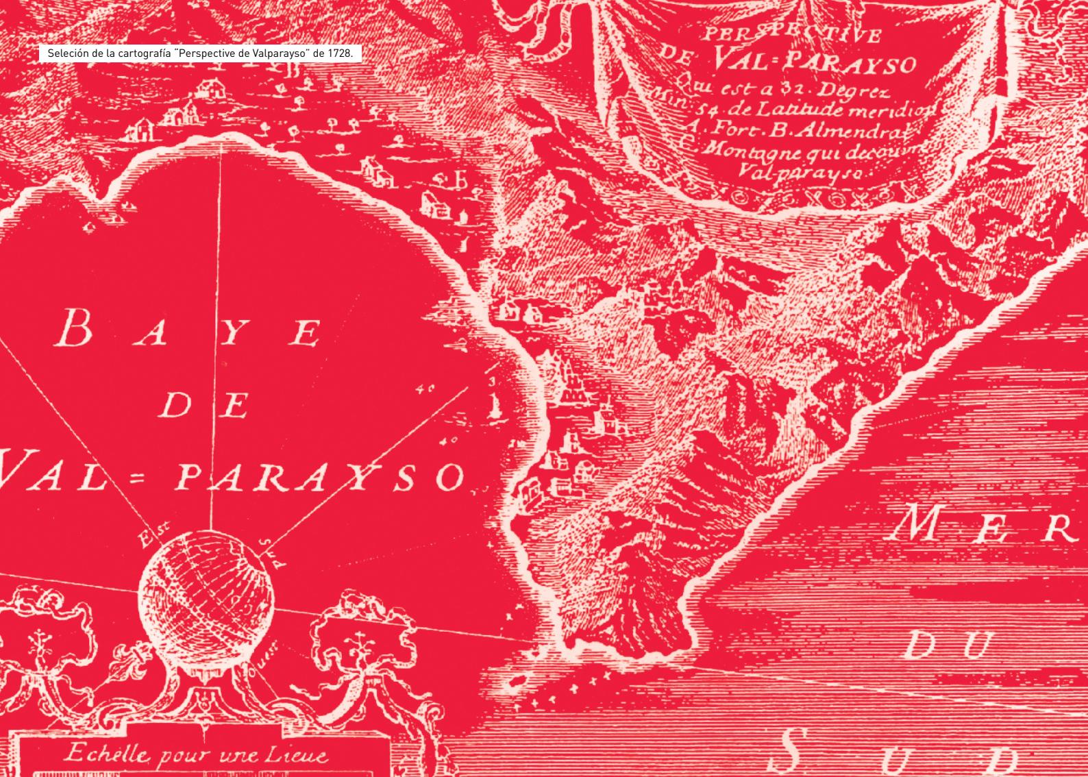
Selección de la cartografía "Perspective de Valparayso" de 1728.