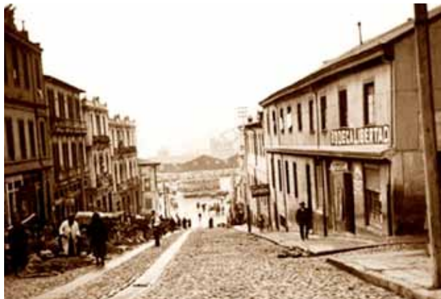
Carampangue principios del S. XX.