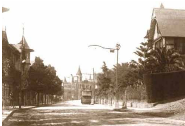
Av. Gran Bretaña.