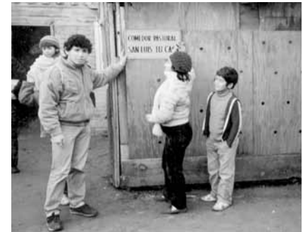
Población Joaquín Edwards Bello.

Fue el transporte público, microbuses de la locomoción colectiva, los que han unido la constelación de barrios que forman el cerro de Playa ancha. En 1960 la Empresa Central Bus extendió el recorrido de la línea 11 hasta el final de la Av. Porvenir, seguido por las empresas Bus Los Placeres y Central Placeres.