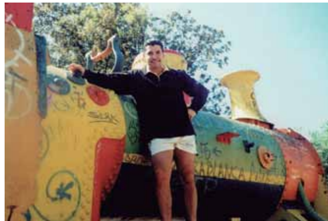
Locomotora Borsig de 1905 robada de la Plaza Waddington en 1996. Autor [a]: Vecino de Playa Ancha.

1870. En este conjunto de terrenos se levantaron las primeras casas, formando los barrios que recibieron el nombre de Playa Ancha. En 1841 se construyó la Plaza Waddington, nombrada así en honor al propietario inglés, símbolo del centro social del barrio de Av. Gran Bretaña y punto de encuentro para los vecinos y vecinas del sector. Característico de la plaza fue el Príncipe Feliz, escultura de